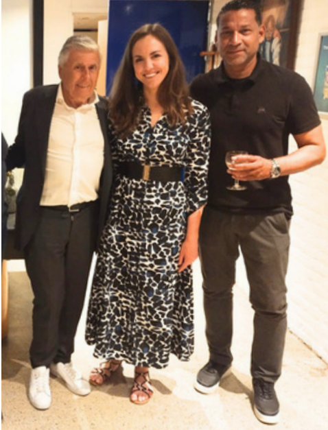
Tussen 2 gasten van de club van 100 sportcafé

De club die door de contributie van hun leden onze vereniging financieel ondersteund, op allerlei gebied (jeugd, kleding voor vrijwillig(st)ers, en diverse projecten in het clubhuis en rondom het veld.